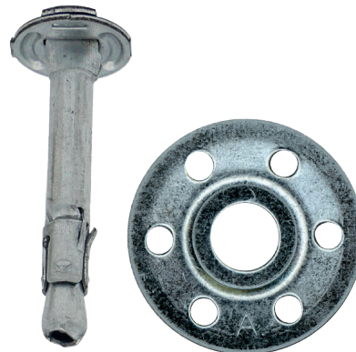
Rondelle Ø 35 mm